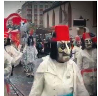
Les caricatures du président turc Recep Tayyip Erdogan durant le Carnaval de Bâle

turcs se montrent parfois très critiques. C'est tout d'abord la demande d'annulation de la visite du ministre des Affaires étrangères Mevlüt Çavusoglu à Zurich par le Conseil d'Etat de ce canton, ensuite annulée par le ministre turc lui-même, qui donne lieu à des articles plutôt factuels (des débats ayant eu lieu notamment en Allemagne sur la tenue de tels meetings, les Pays-Bas ayant interdit à ce même ministre d'en organiser un sur leur territoire). Est rapportée notamment la référence faite par le Conseiller fédéral Didier Burkhalter à la « liberté d'expression ». Les critiques de la presse turque se font plus nettes suite à la publication du Blick d'un article (traduit en turc) appelant à voter contre le référendum turc, puis suite aux caricatures de Recep Tayyip Erdogan brandies lors du carnaval de Bâle. C'est, enfin, le message hostile adressé à ce dernier sur une banderole durant une manifestation à Berne qui rencontre un vif écho et suscite les plus virulentes réactions dans la presse turque vis-à-vis de la Suisse et de l'Europe. Dans les médias des autres pays, le ton est plus factuel.