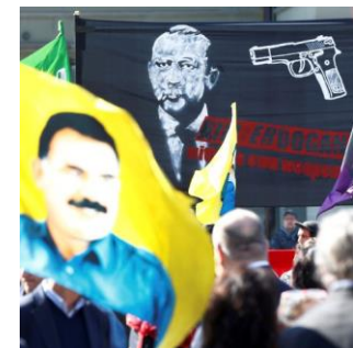
Banderole anti-Erdogan à Berne