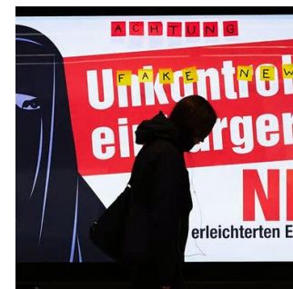
Campagne des opposants à la naturalisation facilitée des étrangers de 3 ème génération

fouillés qui évoquent notamment un contexte international marqué par une pression contre certains privilèges fiscaux, et qui avancent différentes hypothèses quant aux conséquences de ce scrutin. Différents médias notamment anglo-saxons et allemands évoquent par exemple certaines incertitudes quant à l'avenir de la place financière suisse ou encore le système de la démocratie directe.