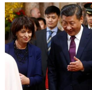
La présidente de la Confédération Doris Leuthard et le président chinois Xi Jinping à Berne

d'activistes de la cause tibétaine ayant défilé à cette occasion, la presse chinoise se focalise sur les relations entre les deux pays et se montre élogieuse sur différents sujets liés à la Suisse tels que ses attraits touristiques. Le WEF et la visite d'Etat de Xi Jinping donnent à voir une Suisse comme haut lieu de débats politiques, économiques et scientifiques.